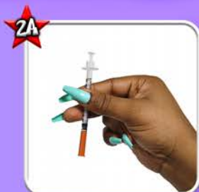
Si vous avez une seringue sertie, ouvrir l'emballage