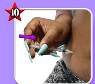
Injecter lentement. Attendre 5s avant d'enlever l'aiguille