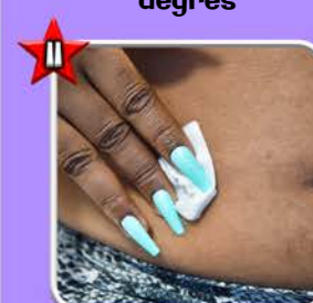
Appuyer avec une compresse pendant 30s