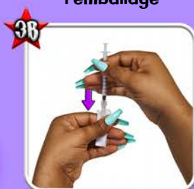
Monter la seringue, puis poser