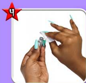
Désinfecter le capuchon en frottant, puis laisser sécher 2*