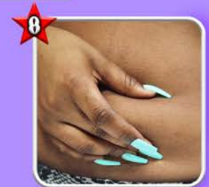
Pincer la peau