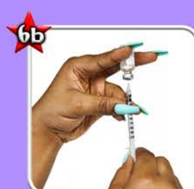
Tirer la dose souhaitée (Technique b) 4*