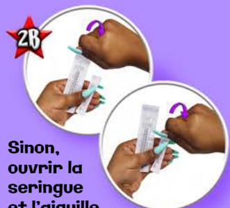
Sinon, ouvrir la seringue et l'aiguille par le haut, puis garder dans l'emballage