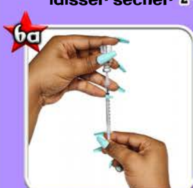
Tirer la dose souhaitée (Technique a) 4*