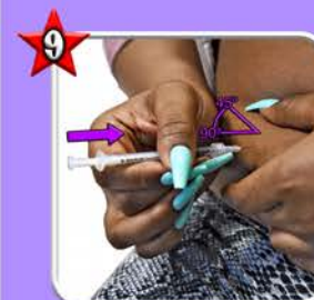
Piquer avec un angle entre 45° et 90° degrés