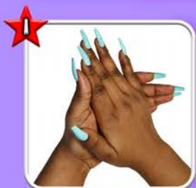
Se laver les mains