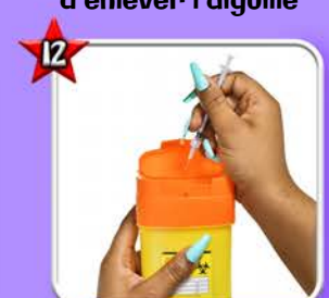
Jeter le matériel d'injection à la DASRI